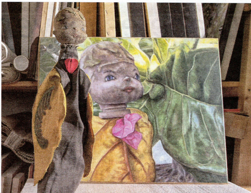
Stabpuppe Anaya posiert auf dem gleichnamigen Gemälde (2013) vor einem Blätterwald. Durch das Malen, sagt der Künstler, fördere er das Wesen seiner Figuren zutage.

Trotzdem denkt der Künstler auch praktisch. Nicht alle Exemplare lassen