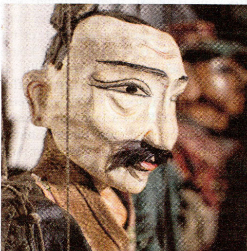
Jobus stammt aus Brima in Asien. Vermutlich ist die Marionette um 1920 entstanden.

sich gut bespielen: einige wiegen mehrere Kilo, andere sind trotz Reparatur in den Gelenken steif oder erfordern beim Bedienen des Kreuzes sehr viel Geschick. Manche würde Schwenck deshalb auch verkaufen – wenn sich denn ein geeigneter Liebhaber für diese Raritäten fände.