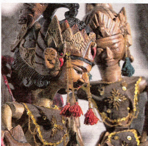
Wayang Golek wird in Indonesien das traditionelle Spiel mit Stabpuppen genannt.